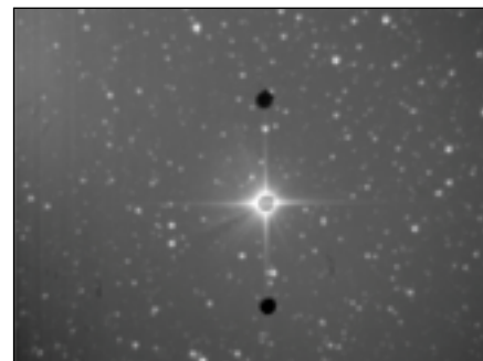
Obrázek z pointační kamery. Na prostředním vlákně (do jednořádkového spektrografu) je nastavena hvězda 12 Vul. Pointační kamera nemusí poskytovat dokonalý obraz. Stačí, aby bylo vždy možné nastavit hvězdu do příslušného vlákna. Proto se na pointaci nepoužívá ani chlazená kamera ani žádné fotometrické filtry. Pointační kamera má limitní magnitudu zhruba 17,5, zatímco spektroskopie je přibližně možná pro hvězdy do magnitudy 14,2.

Nový systém je vybaven třemi optickými vlákny, každé má průměr aktivního jádra (které přenáší světlo) 100 \mu\text{m} , což v primárním ohnisku odpovídá hodnotě 2,3 úhlové vteřiny. To je typický průměrný seeing u Perkova dalekohledu. Do ešeletu je vedeno jedno vlákno, do jednořádkového spektrografu dvě. Jednořádkový spektrograf totiž umožňuje svou konstrukci